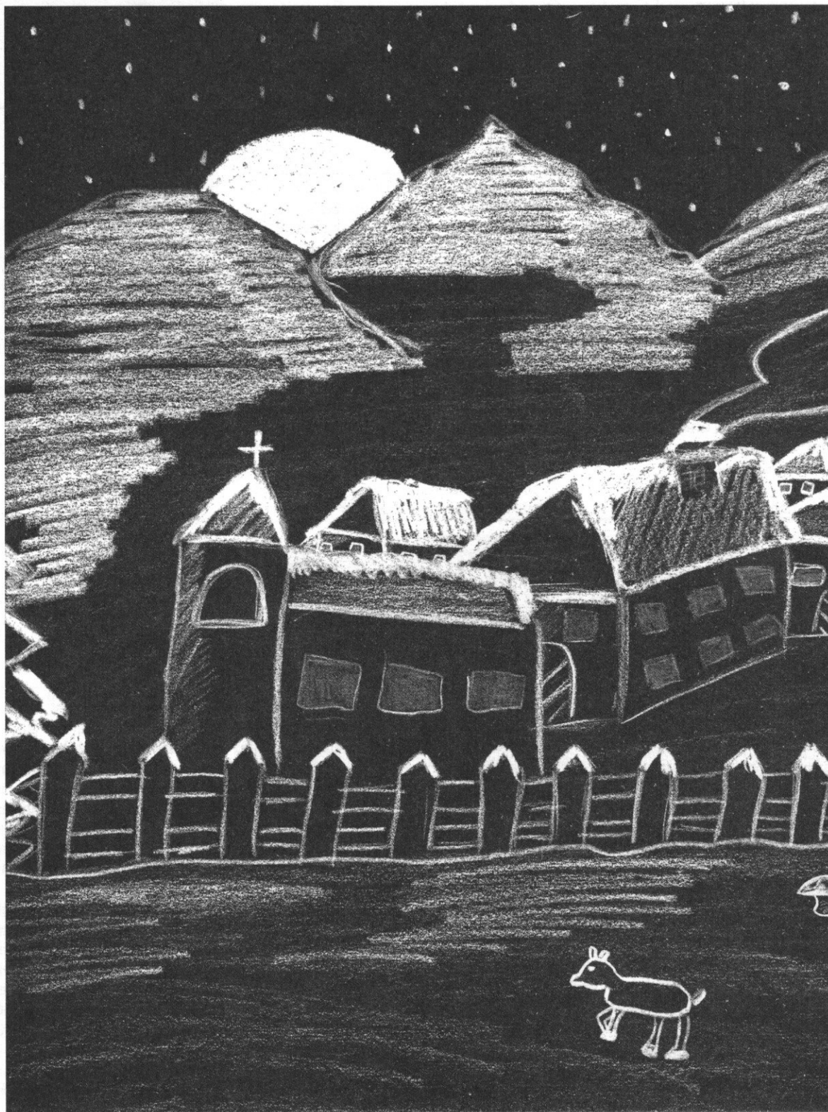
„Weihnachtsdorf“ von Bettina Klimbacher, 2002

VERBINDUNGSBLATT DES BISCHÖFLICHEN SEMINARS UND DES BG TANZENBERG · NR. 4 · JAHRGANG 2004